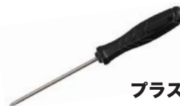
プラスドライバー